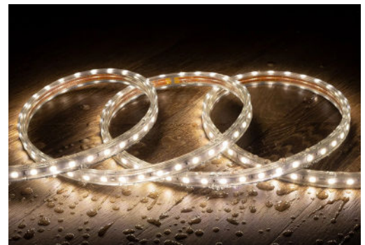
Ruban extérieur LED Ledkia