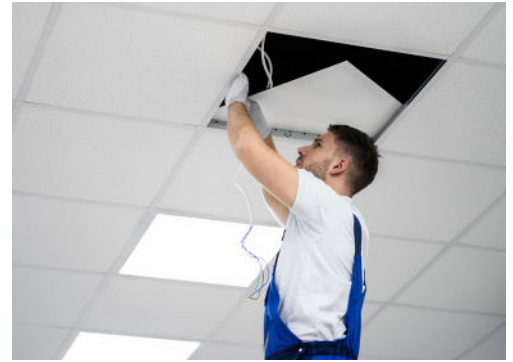
Installation de panneaux LED Ledkia

« La force de Ledkia est d'être à la fois fabricant et distributeur. Cela nous permet de proposer un circuit de distribution très court, sans intermédiaire, et de vendre nos éclairages LED à un prix juste pour le professionnel, avec une qualité équivalente ou supérieure à la concurrence », affirme Paco Mas.